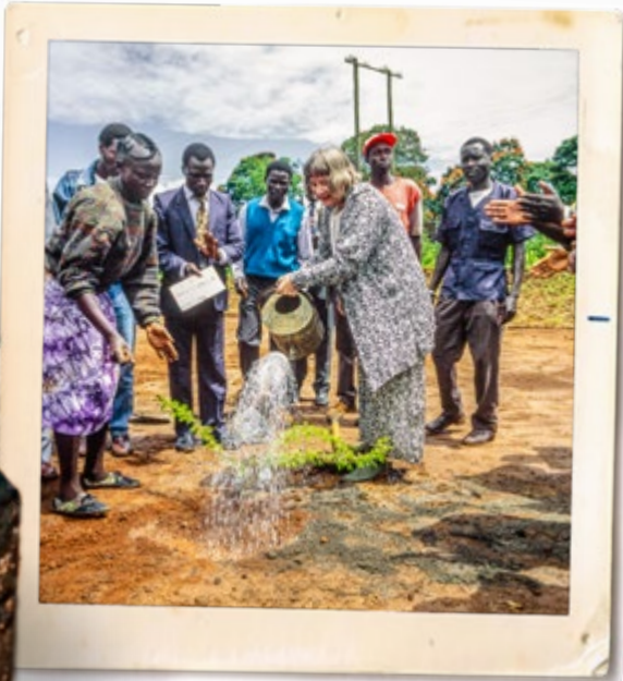
Olof Palme Agroforestry Centre i Kitale, Kenya invigdes i oktober 1992 av bland andra Lisbeth Palme.